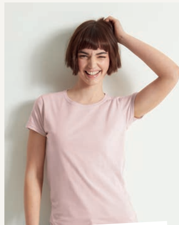
ICONIC 150 T