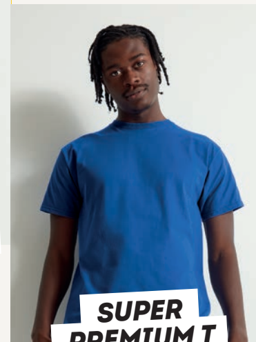
SUPER PREMIUM T