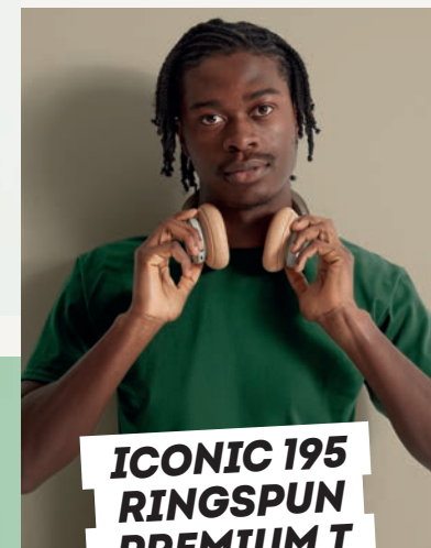
ICONIC 195 RINGSPUN PREMIUM T