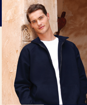
↖ ICONIC PREMIUM SWEAT JACKET