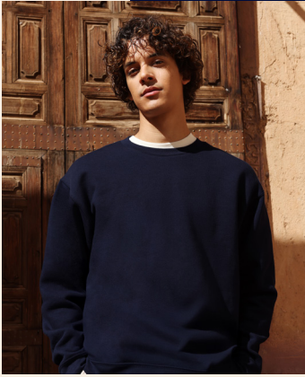
↖ ICONIC PREMIUM SET-IN SWEAT