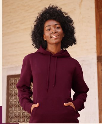
↖ ICONIC PREMIUM HOODED SWEAT