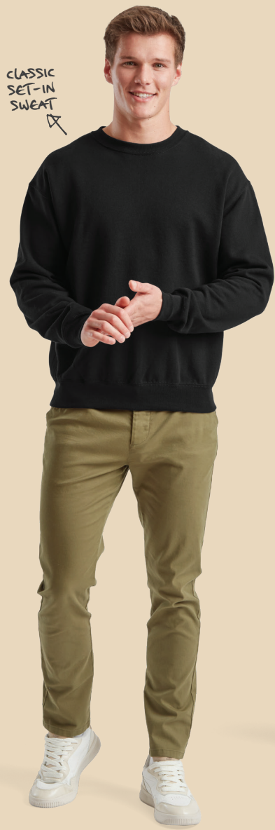
CLASSIC SET-IN SWEAT