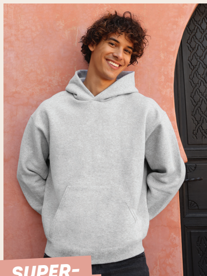
SUPER- COTTON™ SWEATS