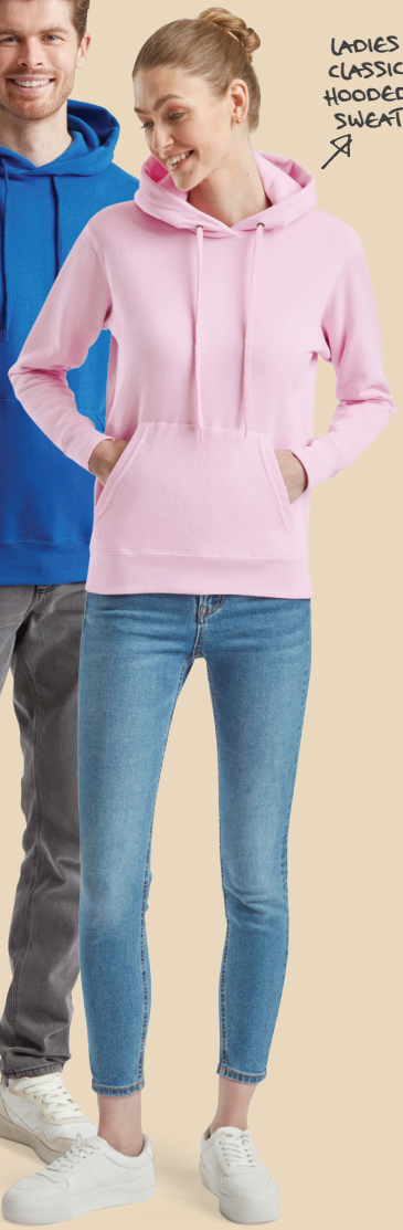
LADIES CLASSIC HOODED SWEAT