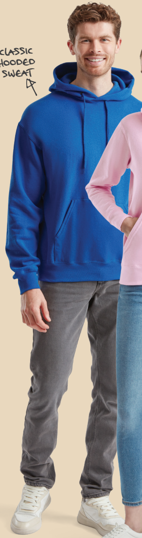
CLASSIC HOODED SWEAT